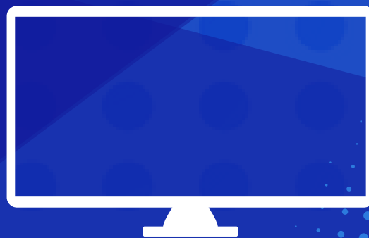
SMART TV 48"